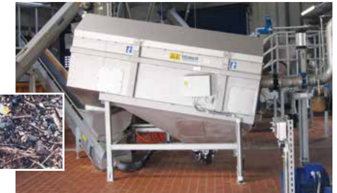
Auswaschen und Abtrennen aller Grobstoffe > 10 mm mit der HUBER Waschtrommel RoSF9.