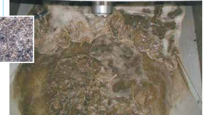
Absieben bei 1 mm und Entwässern (TR ca. 30%) der organischen Stoffe mit der HUBER Siebanlage ROTAMAT®.