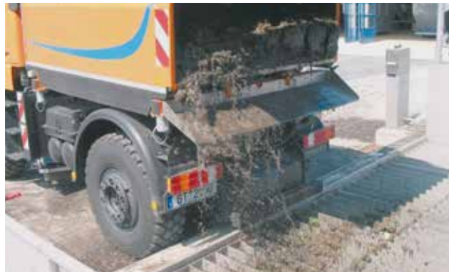
Annahmehunker mit Stabrost und integrierter, horizontaler Dosierschnecke.