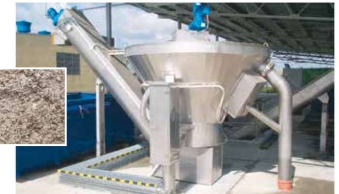
Gewaschener Sand aus der HUBER Coanda Sandwaschanlage RoSF4 mit GV < 3%, Korngröße bis 10 mm, TR > 90%.